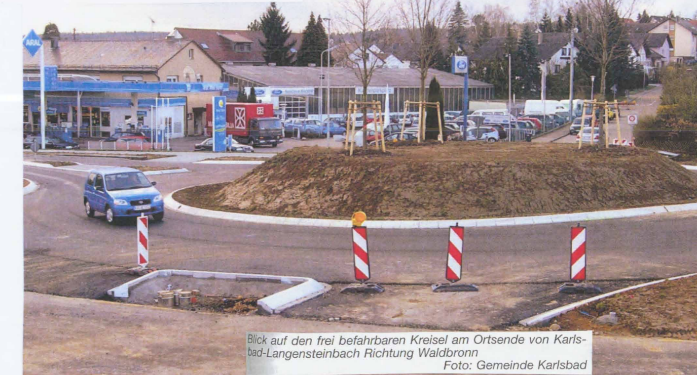
Blick auf den frei befahrbaren Kreislauf am Ortsende von Karlsbad-Langensteinbach Richtung Waldbronn.

Mit dem Einbruch des Frühlings startete die Firma Joos aus Rethem / Südbaden gleich mit den Endarbeiten zur Fertigstellung des Kreisverkehrs am Ortsende von Langensteinbach Richtung Waldbronn. Innerhalb von circa 2 Wochen wurde dieser unter Hochdruck soweit fertig gestellt, dass er frei befahrbar ist. Damit hat die Firma, die schon beim Doppelkreis in der Ortsmitte sehr zügig gearbeitet hat, auch jetzt ein gutes Tempo vorgelegt. Bei der Randentlastungsstraße wird jetzt nach der ersten Bauphase mit dem Verkehrskreislauf die Straße in der Falllinie begonnen werden. Der Baubetrieb hierfür wird das ganze Jahr 2005 in Anspruch nehmen.