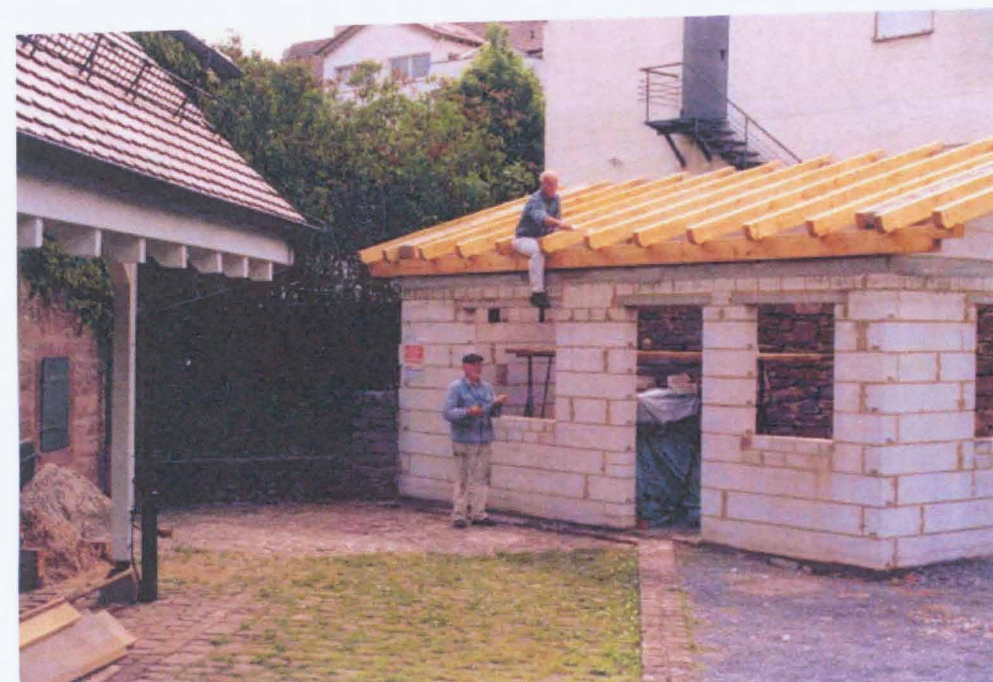
Backhausausbau in Ittersbach

Das Vereinsheim des TSV Auerbach wird abgebrochen.