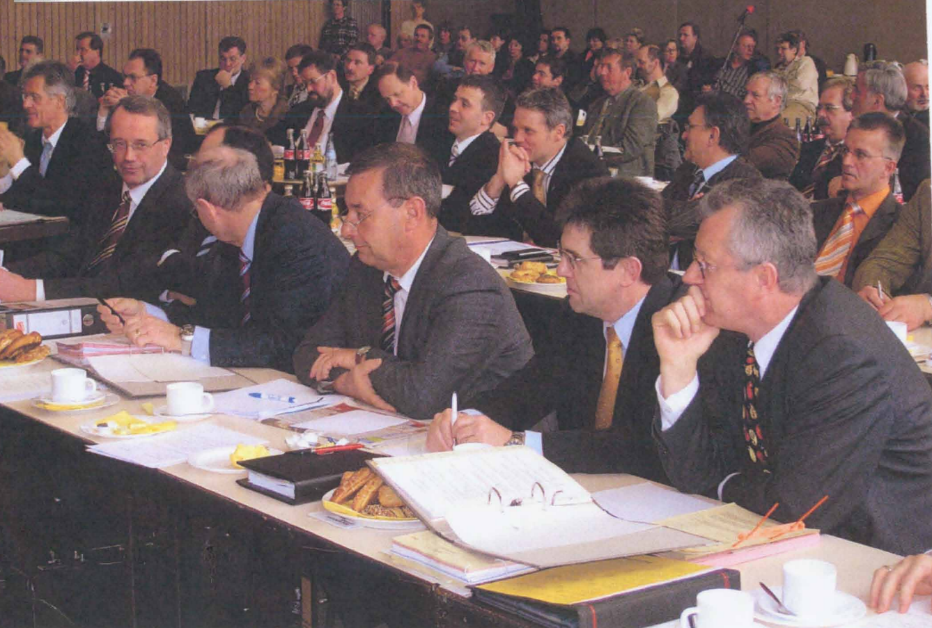
Endrunde von der Kreistagsitzung am Donnerstag, 10. März in Karlsbad-Ittersbach.