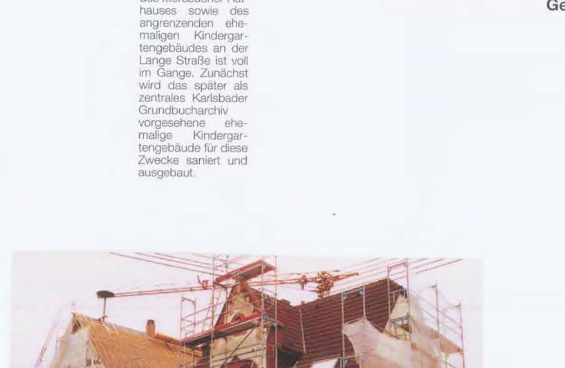
Der erste Bauabschnitt der grundlegenden Sanierung des Ittersbacher Rathauses sowie des ehemaligen Kindergartengebäudes an der Lange Straße ist voll im Gange. Zunächst wird das später als zentrales Karlsbader Grundbucharchiv vorgesehene ehemalige Kindergartengebäude für diese Zwecke saniert und ausgebaut.