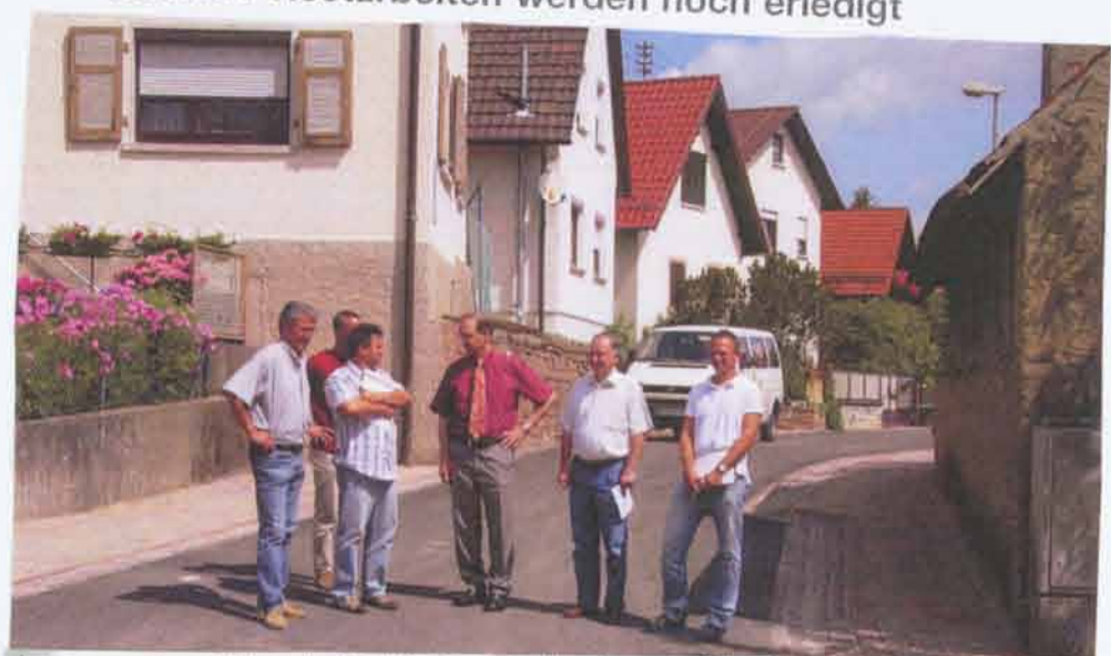
Am vergangenen Mittwoch, 25. Juli, fand die Abnahme der Obere Dorfstraße in Karlsbad-Ittersbach statt. Zwischen der Weller- und Straße und der Eichgasse wurde auf 520 Metern die Straße abgebaut und zusätzlich auf 350 Metern die Wasserhaushaltung DIN 150 bis zu den jeweiligen privaten Grundstücksgrenzen erneuert. Gestaltlich wurde die Obere Dorfstraße im Gehwegbereich mit farblichen Akzenten und Sandsteinbelag optisch aufgewertet. An allen Gehwegübergängen wurden die Höhen rollstuhlgerecht abgesenkt. Besonders erfreut zeigten sich die Beteiligten darüber, dass die Bauzeit wesentlich auf vier Monate verkürzt werden konnte. Die Arbeiten seien sauber und zügig vorangetrieben gegangen. Geplant war ursprünglich der 14. September als Fertigstellungstermin.