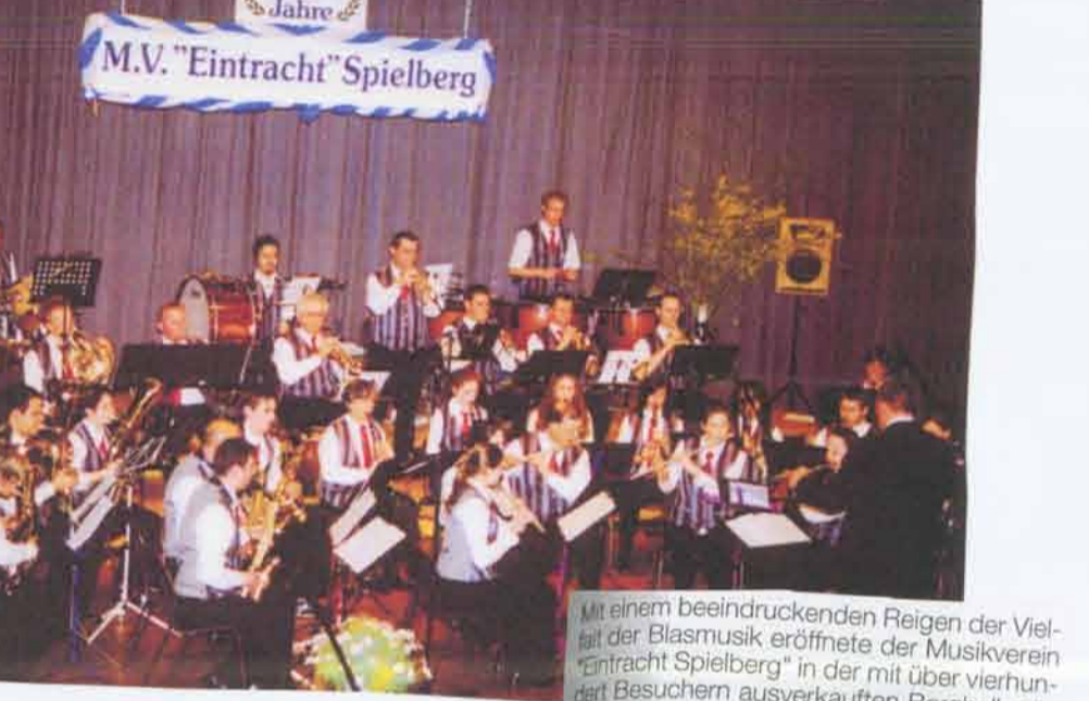
Mit einem beeindruckenden Regen der Viel der Blasmusik eröffnete der Musikverein "Eintracht Spielberg" in der mit über vierhundert Besuchern ausverkauften Berghalle die Feier seiner Veranstaltungen zum 50-jährigen Jubiläum in diesem Jahr. Verbunden damit ist die Festbank mit Ehrungen der Jubiläumsgäste. Unterstützt wurde von Blasmusikvereinen im musikalischen Teil von Blasmusikvereinen des Patenvereins "Harmonie" Etzenrot.