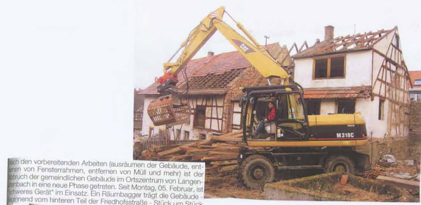
Die vorbereitenden Arbeiten (ausräumen der Gebäude, Entzug von Fensterbänken, Entfernen von Mäul und mehr) ist der erste Schritt der gemeindlichen Gebäude im Ortszentrum von Langensteinbach in eine neue Phase getreten. Seit Montag, 05. Februar, ist ein "Garten" im Einsatz. Ein Rückbagger trägt die Gebäude, Stück um Stück, in den Freizeitanlagen - Stück um Stück.