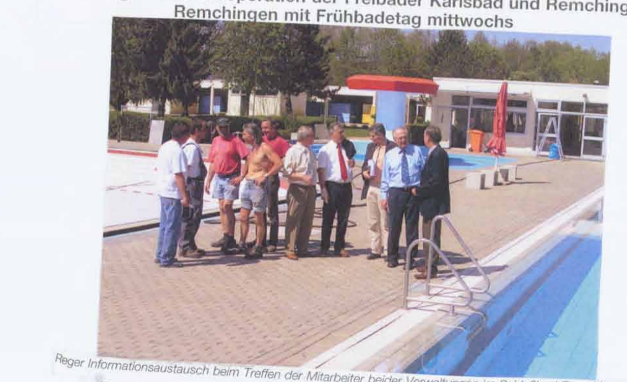
Regier Informationsaustausch beim Treffen der Mitarbeiter beider Verwaltungen im Schulbad Remchingen. Mit den ansteigenden Temperaturen rückt die Badzeit immer näher. In Kürze werden die Freibäder Karlsbad und Remchingen ihren und ihr Angebot gemeinsam der Bevölkerung präsentieren. Beide Bäder liegen nur 8 Kilometer voneinander entfernt in unmittelbarer Nachbarschaft.