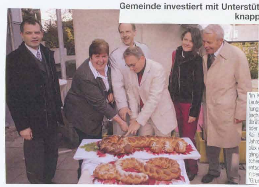
Im Kindergarten, im Kindergarten, da fangen alle mal als kleine Laus an", sangen die Kinder zum Auftakt der offiziellen Einweihung des "Fellnhauses" des evangelischen Kindergartens in Auerbach. Bürgermeister Rudi Knodel erinnerte an die in den gemeinsamen Gärten verabschiedete Abwägung zwischen Abriss oder Teilerneuerung des im Jahre 1972 in starker Hanglage "in der Kalte" in Auerbach errichteten Kindergartengebäudes, das im Jahre 1986 erweitert wurde. Seit Jahren wisse der Gesamtkomplex erhebliche bauliche Mängel auf, die eine Erneuerung unumgänglich machen. In enger Zusammenarbeit mit der Evangelischen Kirchengemeinde Auerbach als Träger dieser Einrichtung, entschloss sich die Gemeinde als Bauherr für einen Teilerneuerung, indem das ursprünglich massiv erbaute Untergeschoss in seinem Grundriss erhalten blieb.