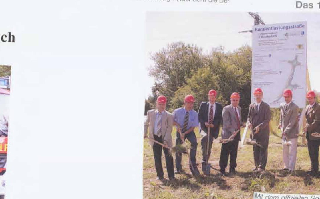
Mit dem offiziellen Spatenstich wurde der zweite Bauabschnitt der Randentlastung in Langensteinbach im Rahmen des Gesamtverkehrskonzeptes eingeleitet. Das Kostenvolumen liegt bei rund 1,2 Mio. Euro und verbessert die Zufahrt zum Autobahnzubringer.