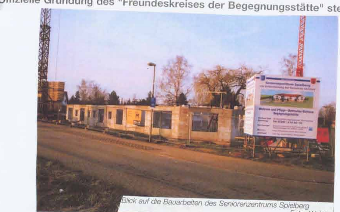
Sicht auf die Bauarbeiten des Seniorenzentrums Spielberg.

Im vergangenen Winter verließen die Bauarbeiten des künftigen "Seniorenzentrums Spielberg", wie Ortsvorsteher Reinhard Haas auf Anfrage berichtete. Im Oktober vergangenen Jahres fand die erste Spatenstichfeier für dieses Großprojekt statt und bereits zum Ende dieses Jahres sollten die Räumlichkeiten bezugsfertig sein. Das Konzept der Bauarbeiten im Erdgeschoss sind zwölf für die Senioren im Erdgeschoss und im Obergeschoss insgesamt 26 Pflegeplätze. Im zweiten Obergeschoss sind zwölf gut ausgestattete Wohnungen, jeweils mit Balkon für betreutes Wohnen vorgesehen. Diese so genannten betreuten Wohnungen sind sowohl von Kaufleuten als auch von Mietern genutzt werden. Die größte Bedeutung hat für Ortsvorsteher Haas auch die dritte Ebene im Erdgeschoss rund 110 Quadratmeter große öffentliche Begegnungsstätte.