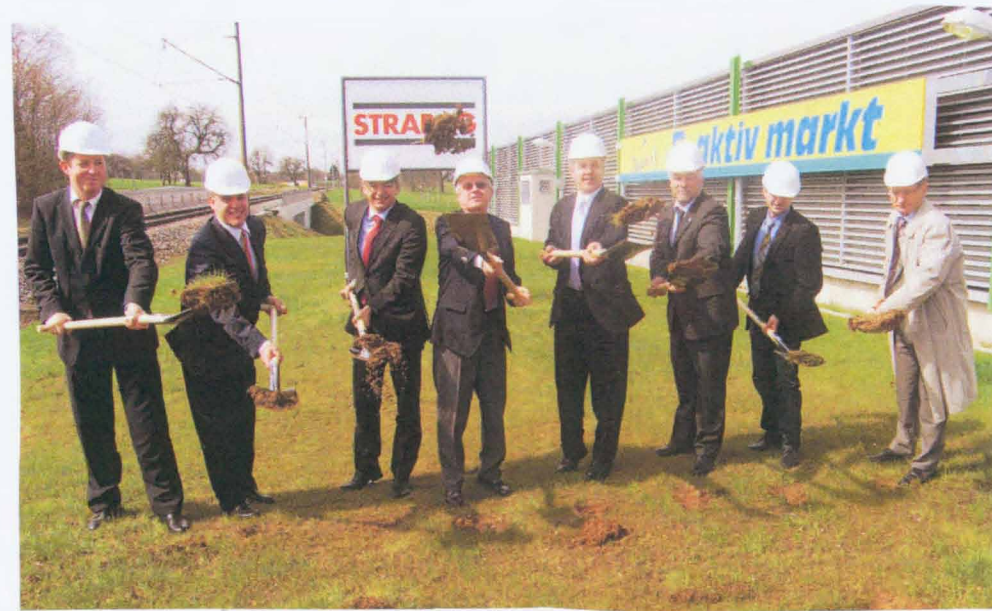
Zweigleisiger Ausbau der Stadtbahnstrecke zwischen Langensteinbach und Reichenbach startet Wichtiges Infrastrukturvorhaben für Gemeinde Karlsbad

Der zweigleisige Ausbau der Strecke der Albtal-Verkehrs-Gesellschaft (AVG) zwischen Heichenbach-Langensteinbach beginnt ab 1. April, also in der Woche nach Ostern. Die entsprechende Freigabe der AVG erreichte die Gemeindeverwaltung am vergangenen Montag, 22. März. Die eingleisige Bahnstrecke zwischen Heichenbach und dem Bahnhof Langensteinbach erhält ein zweites Gleis. Neu gebaut wird der Haltepunkt Scheithüttenacker im Ortsteil Heichenbach (hinter dem dortigen Edeka-Markt). Außerdem wird die Eisenbahnüberführung über die Landesstraße 562 (Ettlinger Straße) vorbrückt sowie der Bahnhof Langensteinbach umgebaut. Alle Arbeiten sollen bis Oktober 2011 abgeschlossen sein.