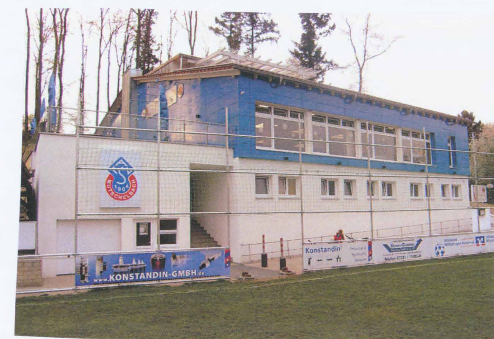
Vereinsheim eingeweiht ATSV-Mutschelbach feierte Abschluss von Großprojekt