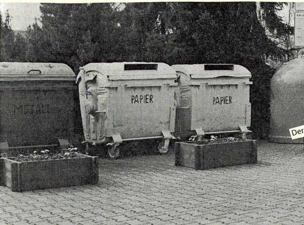
DIE KARLSBADER BEVÖLKERUNG wurde aufgefordert, sich gewissenhaft an den Recyclingangeboten der Gemeinde Karlsbad zu beteiligen und die Wertstoffgefäße zu benutzen.