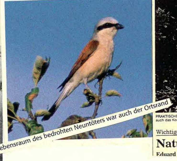
Der Lebensraum des bedrohten Neuntöters war auch der Ortsrand

Antrag an Landschaftspfleger: Grünpflege kostet viel Geld In Karlsbad Kauf eines Großflächenmähers beschlossen