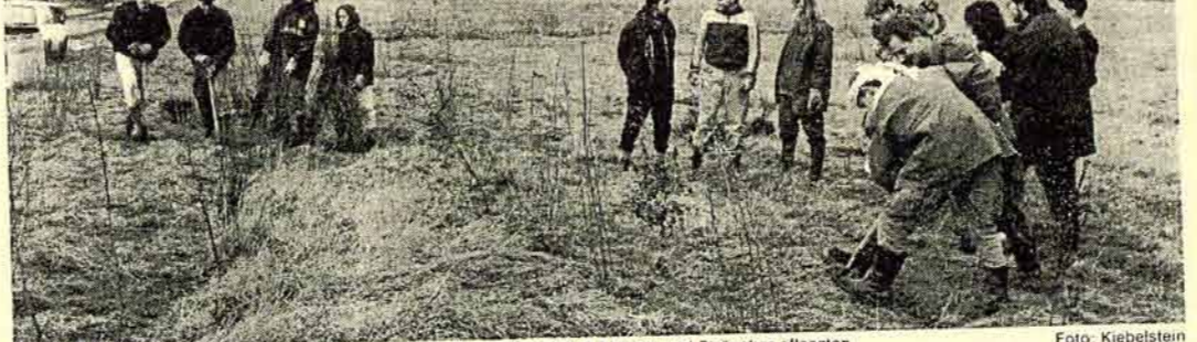
VORÜBERLICHEN ERSATZ mussten die Jugendlichen alle bis über 1 000 Hecken und Straucher pflanzen

Gemeinde Karlsbad unterstützt Bürger bei der Neu- und Nachpflanzung von Büschen