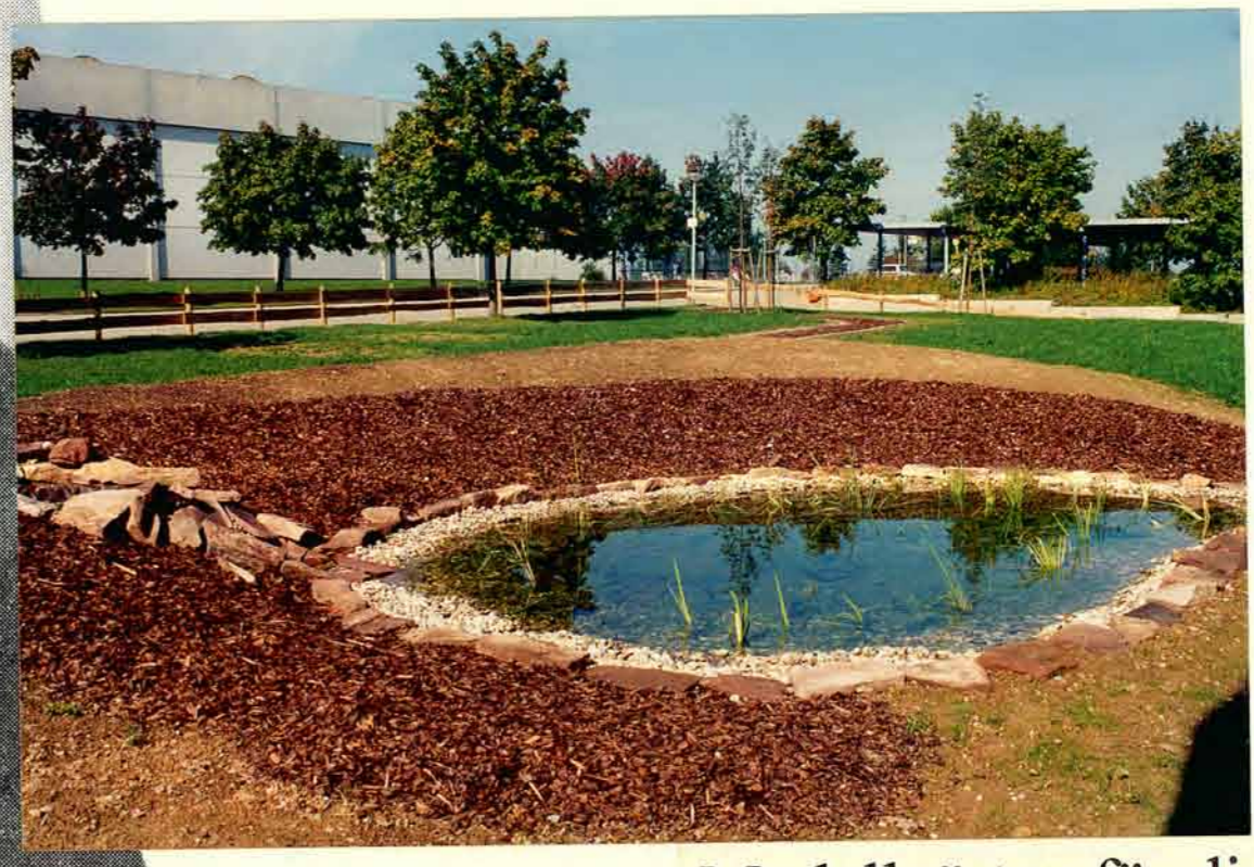
Modellgärten für die Schulen