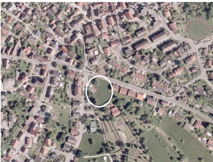
Abb.: Lage des Plangebiets zwischen Pfinztal- und Belchenstraße