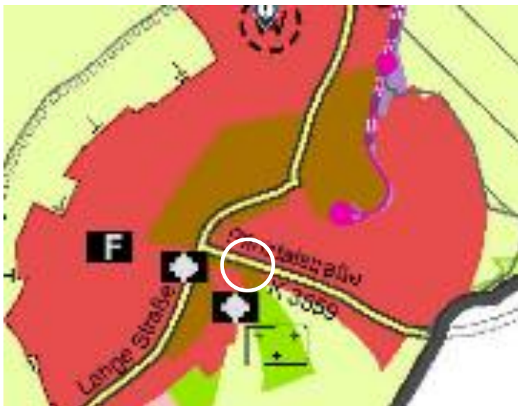
Abb.: Ausschnitt aus dem rechtsgültigen Flächennutzungsplan

Das Plangebiet ist im rechtskräftigen Flächennutzungsplan als gemischte Baufläche dargestellt. Im Bebauungsplan wird als Art der baulichen Nutzung „Allgemeines Wohngebiet“ festgesetzt.