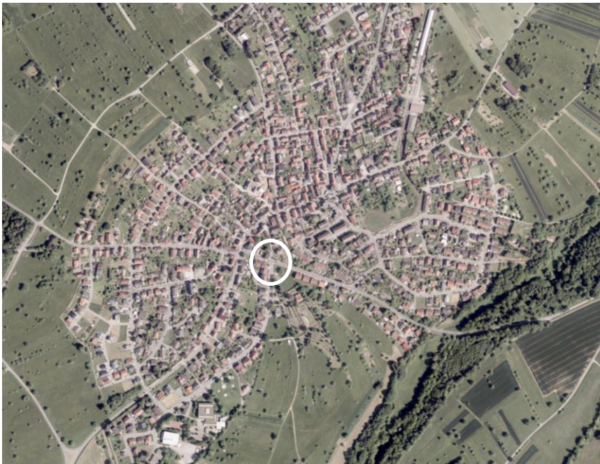
Abb.: Lage des Plangebiets in der zentralen Ortslage Ittersbach

In der zentralen Ortslage des Karlsbader Ortsteils Ittersbach liegt südöstlich der Einmündung Pfinztalstraße / Belchenstraße ein ca. 3.200 qm umfassendes, unbebautes Areal (im Weiteren mit Plangebiet bezeichnet). Westlich des Plangebiets stehen entlang der Pfinztal- und Belchenstraße dreigeschossige Baukörper mit gemischter Nutzung (Sparkasse, Gastronomie, Dienstleistung und Wohnen). Östlich schließen 2½-geschossige Doppelhäuser mit Wohnnutzung an. Südlich des Plangebiets liegen Parkierungsflächen für die angrenzende neuapostolische Kirche und den südöstlich gelegenen Friedhof mit Aussegnungshalle.