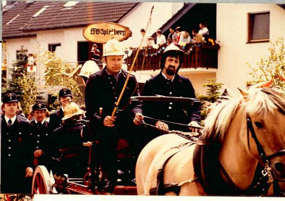
Vor dem Brezel-Backhaus