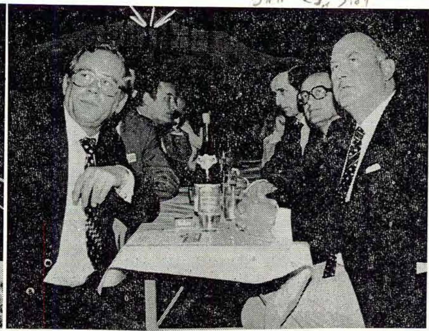
Festabend zum 700. Jubiläum