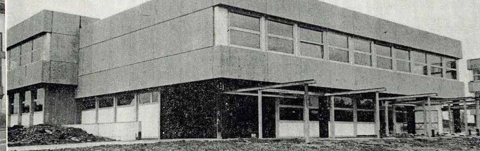
JULIAHRESBEGINN wird im dritten Bauabschnitt des Langensteinbachschulzentrums, der heute offiziell übergeben wird, unterrichtet. Der Bau wurde wegen der geburtenstarken Jahrgänge und dem verstärkten Wechsel in das Gymnasium nötig.