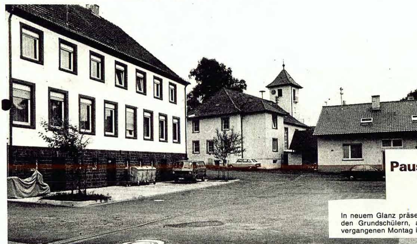
Als gelungen darf die Neugestaltung des Auerbacher Rathausplatzes bezeichnet werden.

gruppieren. Unter dem Motto „Auerbacher Dorffest“ bieten die „Akteure“ neben Spezialitäten aus Omas Küche auch deftige Hausmannskost, ja sogar verwöhnte Gourmets kommen auf ihre Kosten.