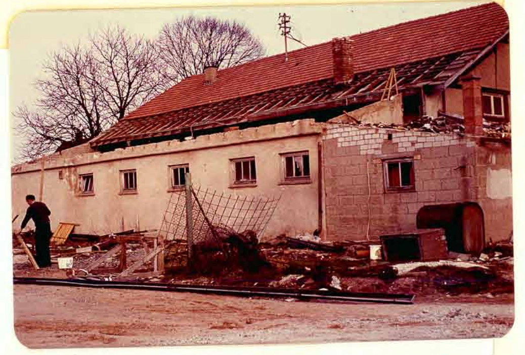
Abbruch der alten Turnhalle

Ittersbach von oben, vor dem Bau der Mehrzweckhalle und vor der Bebauung an der Belchenstraße und in den Grabenäckern