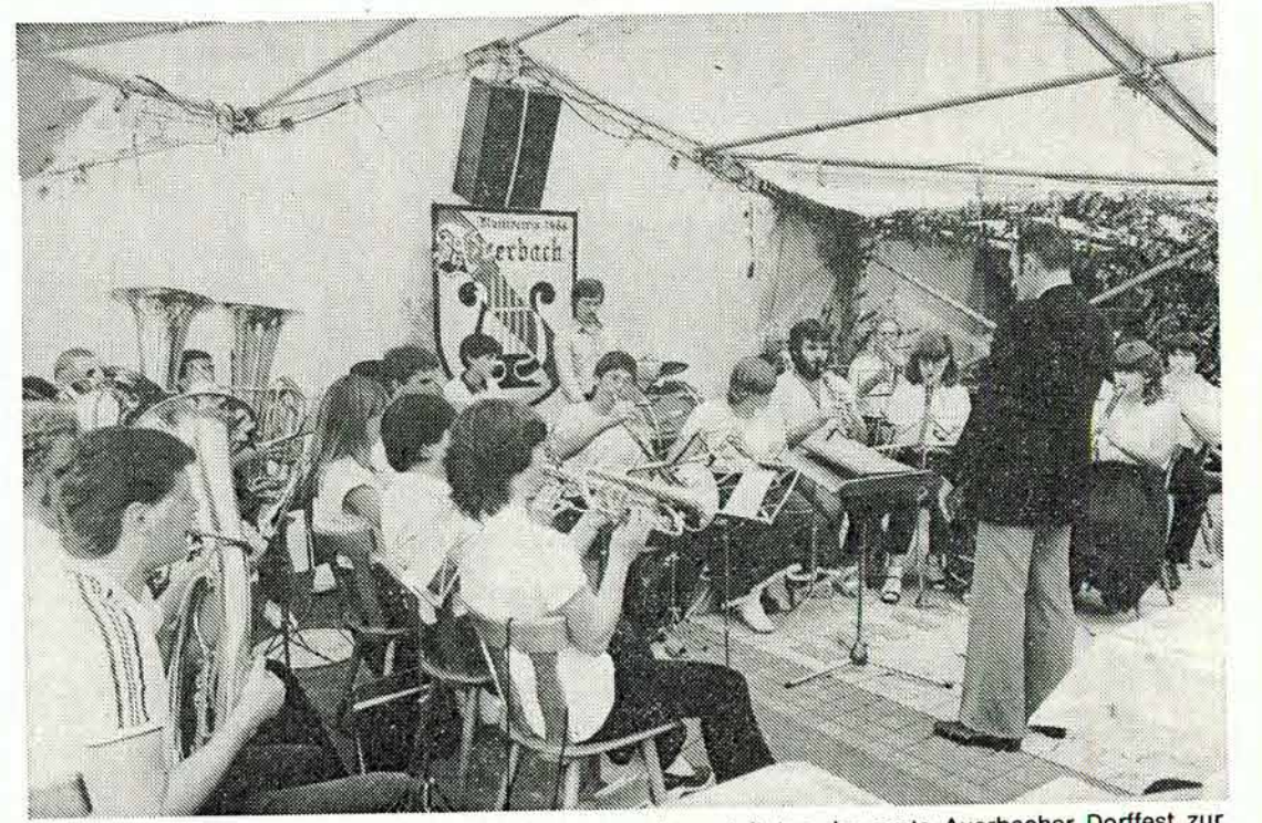
DER MUSIKVEREIN AUERBACH und der Gesangsverein gestalteten das erste Auerbacher Dorffest zur Übergabe des neugestalteten Rathausplatzes musikalisch aus.

Unterhaltungs- und Geschicklichkeitsspiele sorgen für Abwechslung. Ebenso wurde an die Kinder gedacht, die sich mit Basteln, Töplern und Malen beschäftigen können. Kurzum: Nach den Vorstellungen der Initiatoren soll es ein rundum gemütliches Dorffest werden, das vor allen Dingen auch dazu beiträgt, die Kontakte zwischen Alt- und Neubürgern zu festigen.