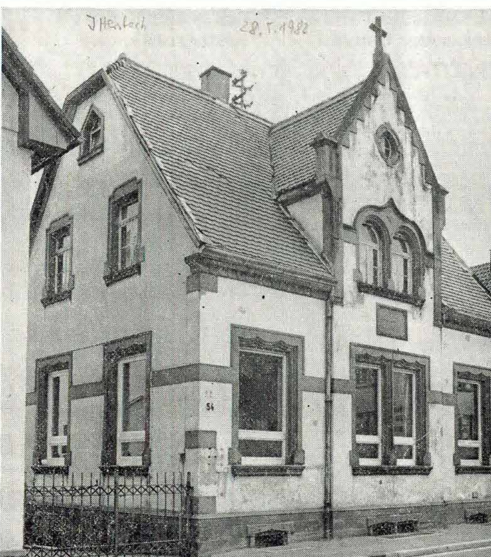
Alter Kindergarten wird Sozialstation

KARLSBAD-LANGENSTEINBACH. Ein volles Programm hatten die Karlsbader Verwaltung und der Gemeinderat am Mittwoch. Nur wenige Stunden nach der Übergabe der sogenannten Müllstraße (siehe Bericht auf der ersten Lokalseite) stand im Schulzentrum Langensteinbach die offizielle Übergabe des Erweiterungsbaus mit Aula an (siehe Bericht am Mittwoch auf der Kreisseite). Durch das neue Gebäude wurden am Schulzentrum nun die Voraussetzungen für einen weitgehend geordneten Unterrichtsablauf und die Erfüllung des pädagogischen Lehrauftrags geschaffen.