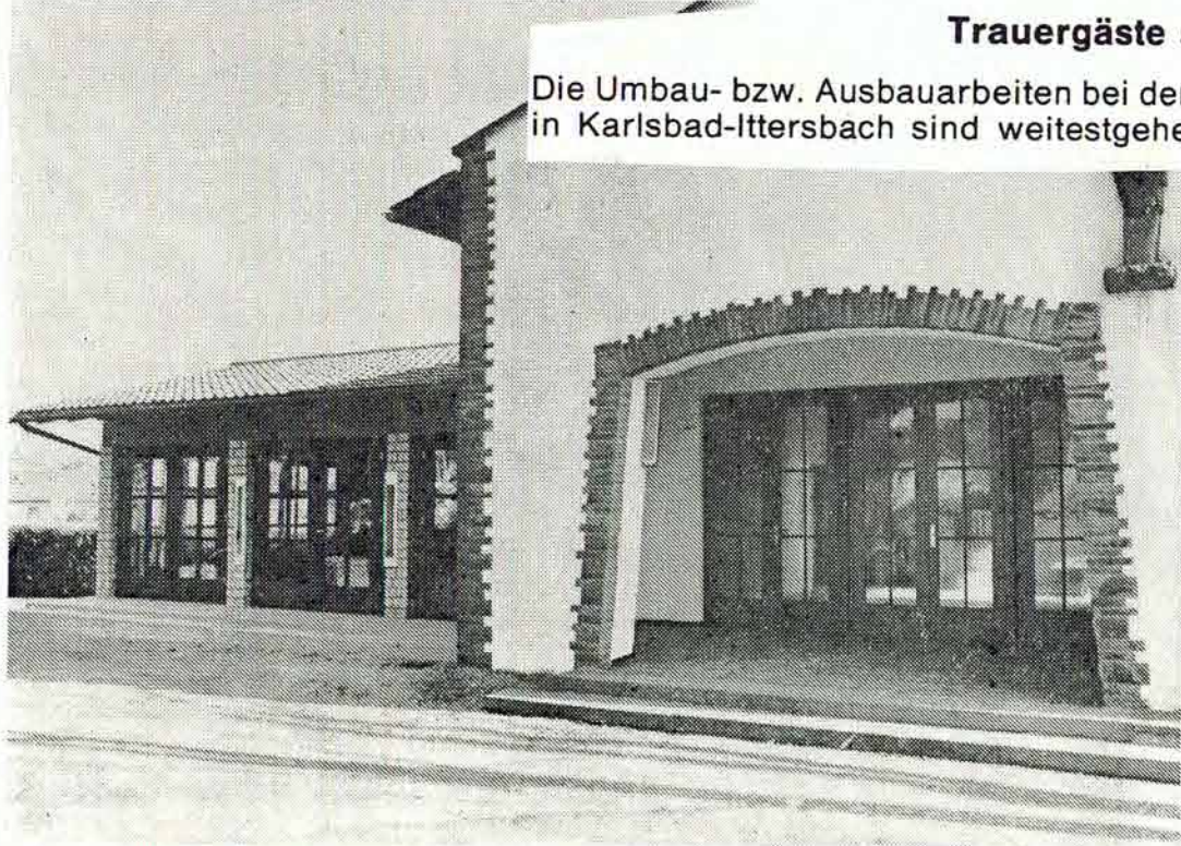
DIE AUSBAUARBEITEN an der Leichenhalle in Karlsbad-Ittersbach werden bald abgeschlossen sein. Für die Aussegnungsteier steht dann soviel Platz zur Verfügung, daß niemand mehr im Freien zu stehen braucht.

Die Umbau- bzw. Ausbaurbeiten bei der Aussegnungshalle in Karlsbad-Ittersbach sind weitestgehend abgeschlossen. Lediglich noch einige kleinere Arbeiten im Anbau selbst müssen noch durchgeführt werden.