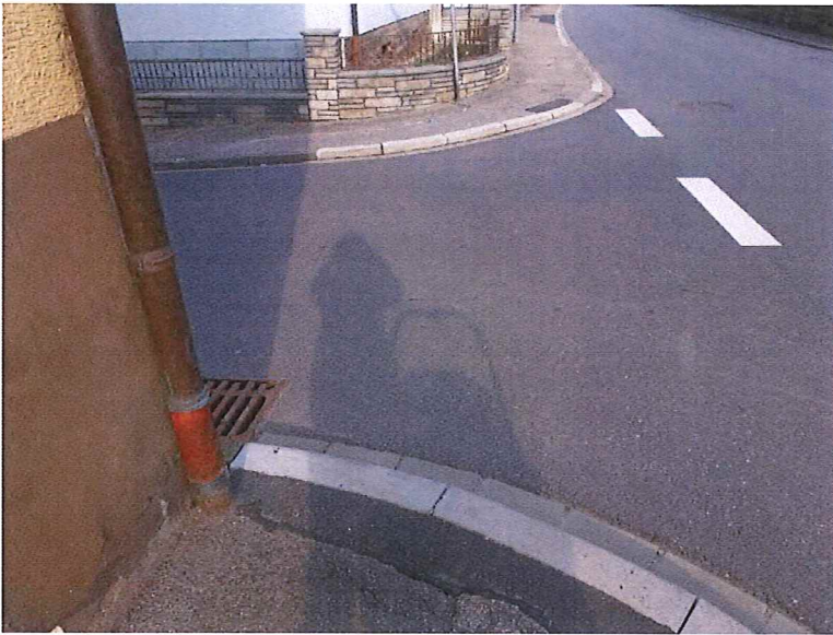
Bild Nr.1 Forlenstr./Mündungsbereich Remchingerstr.