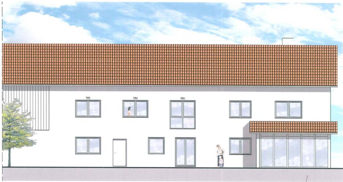
ANSICHT SÜD-WEST M 1:100