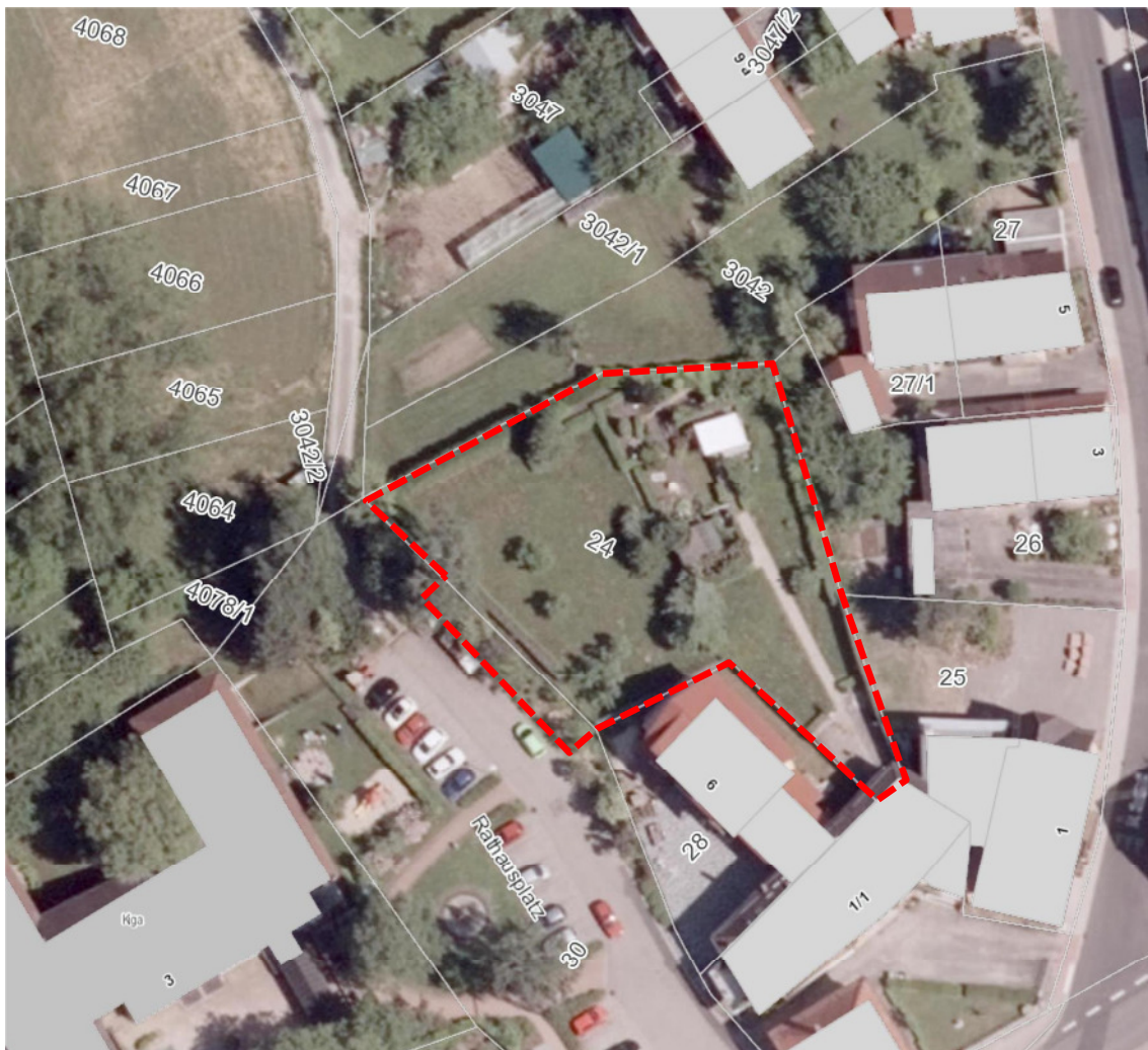
Abb. 2 Luftbild mit Geltungsbereich