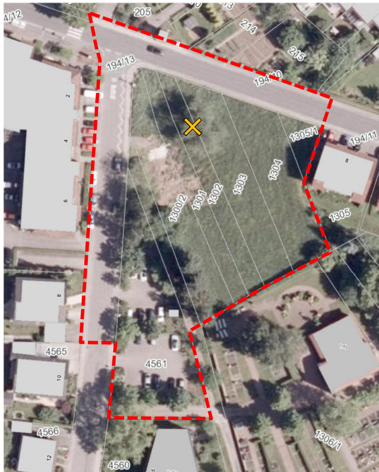
Abb. 2 Luftbild mit Geltungsbereich